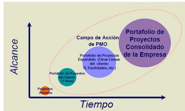
Fig 3: Mapa de maduración de gestión de proyectos de una empresa